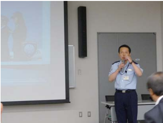
演 題 「関税業務の概要について」 スピーカー 中部空港税関支署 税関広報広聴官