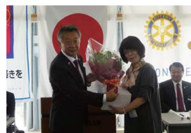
事務局員への感謝と記念品贈呈